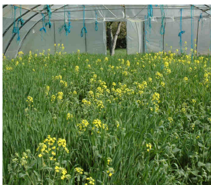
Exemple de mélange associé colza/orge sous serre

(d'après Monnier G. 1965. Action des matières organiques sur la stabilité structurale des sols. Ann. Agro. 16 (4 et 5) : 327-400 et 471-534).