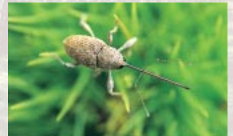
Balanin des châtaignes adulte