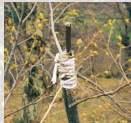
Attache sur greffe