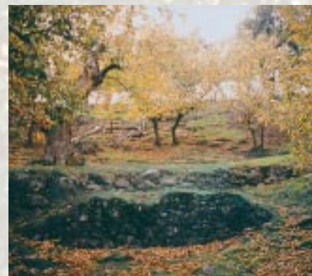
Filets dans vergers