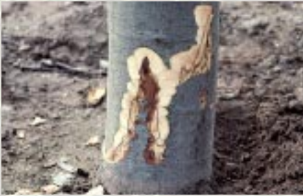
Maladie de l'encre sur châtaignier