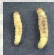
Chenilles de carpocapse à différents stades