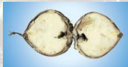
Chenille et dégât du carpocapse