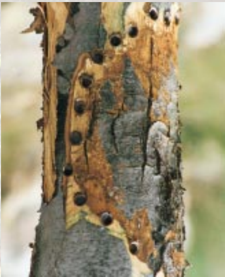
Endothia chancre traité