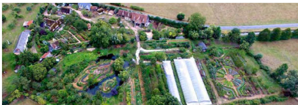
Ferme du Bec Hellouin

La ferme bio du Bec Hellouin en Normandie développe depuis 2007 « un modèle de maraîchage original, associant une organisation de l'espace inspirée de la permaculture et de techniques du maraîchage biointensif » (E. COLEMAN, J. JEAUVONS, etc.). La permaculture est encore peu étudiée en France et beaucoup s'interrogent sur sa «vivabilité» et sa viabilité économique. C'est pourquoi une équipe constituée des membres de la ferme, de l'institut Sylva et de l'unité de recherche SAD-APT (INRA AgroParisTech) a piloté une étude de décembre 2011 à mars 2015 sur la rentabilité économique de 1 000m 2 de maraîchage de la ferme. Les données prennent en compte à la fois le temps de travail, les quantités récoltées, les prix et les revenus dégagés. Le rapport final est désormais disponible.