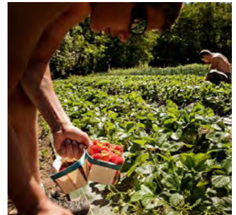
Les Jardins d'Ys

Nous sommes en réflexion sur un système de lieu de dépôt des commandes dans les localités rurales pour à la fois réduire les déplacements vers les villes pour les courses et aussi optimiser nos tournées de livraison. En un mot, comment amener davantage de service en zone rurale ?