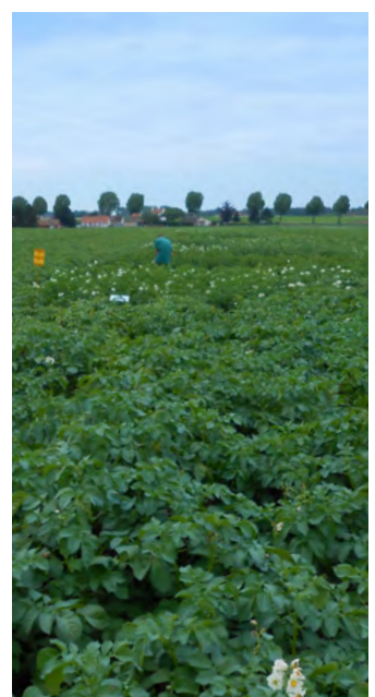
Champ de pommes de terre

En circuit spécialisé bio, les prix ont également reculé par rapport à la campagne précédente: -6% pour les chairs fermes (1,79 €/kg) et -5% pour les chairs normales (1,77 €/kg).