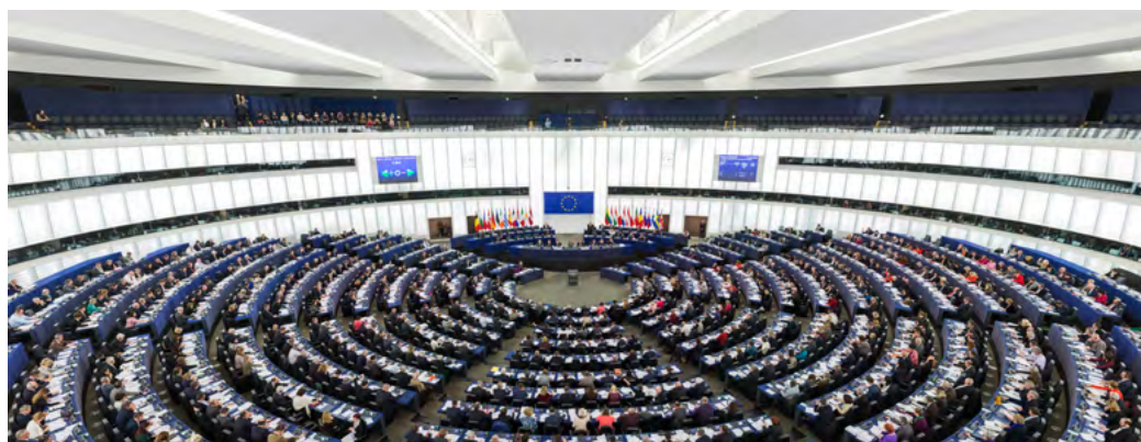
Hémicycle du Parlement européen à Strasbourg